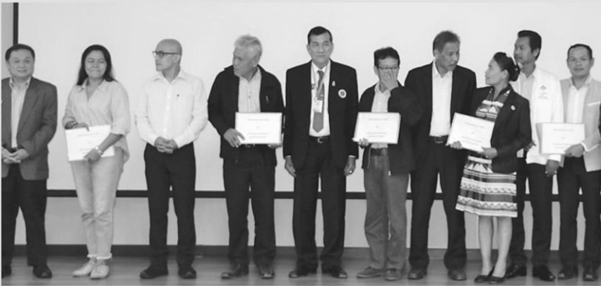
เครือข่ายสภาองค์กรชุมชนตำบลยื่นหนังสือต่อตัวแทนพรรคการเมือง

ปัญหาที่ดินมี 4 ด้านที่รอการแก้ไข คือ 1.ปัญหาที่ดินชุมชนทับซ้อนกับพื้นที่ของรัฐ 2.ปัญหาที่ดินเกษตรกรรมหลุดมือ 3.ปัญหาการใช้ประโยชน์ที่ดินไม่เต็มที่ และ 4.ปัญหาการบุกรุกทำลายป่า นอกจากนี้เมื่อเกษตรกรส่วนใหญ่ไม่มีความมั่นคงในที่ดินทำกิน จึงอพยพเข้าเมืองนำไปสู่ปัญหาคนจนเมือง เครือข่ายสภาฯ จึงมีข้อเสนอ ดังนี้