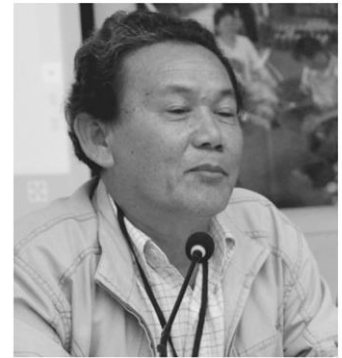
ชูชาติ ผิวสว่าง

ตะวันออก 2.ผลกระทบจากการทำเหมืองแร่ 3.ราคาผลผลิตตกต่ำ และ 4.ผลกระทบการก่อสร้างรถไฟรางคู่ รถไฟความเร็วสูง และถนนมอเตอร์เวย์